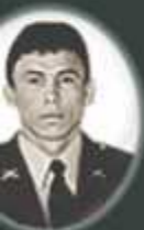
INTENDENTE LEON ROJAS MEDINA 1999